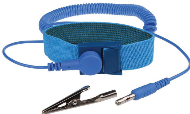
Figura 1.5. Hay distintos modelos de pulseras antiestáticas. Busca una que sea cómoda y no tenga tantos cables. Los precios son variados y dependen del material con que estén fabricadas.