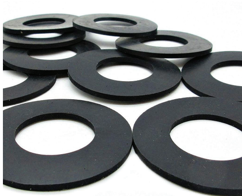
Figura 1.6. Las arandelas antiestáticas no son de metal, y desde ya, no se suplantán por ningún material que no sea el antiestático. Se venden en casas de electrónica y se usan para prevenir descargas de este tipo de energía. Algunos motherboards actuales tienen una protección incorporada, pero no está de más usarlas.