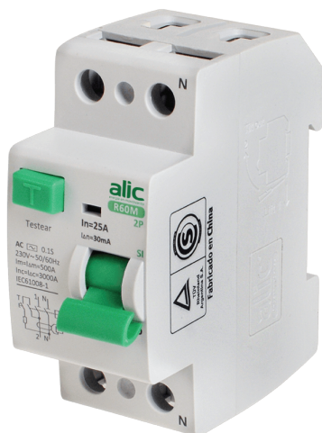
Figura 1.1. Un disyuntor es un interruptor automático capaz de provocar un corte en el suministro eléctrico cuando ocurren fallas como cortocircuitos. Protege la vida humana y evita daños mayores en los equipos electrónicos.

Otro punto no menor es el botiquín de primeros auxilios. Como en muchas tareas donde se usan herramientas y se ejerce fuerza, puedes lastimarte. Por eso, ten a mano un kit que te permita remediar el problema de manera urgente y volver rápido a la actividad si es que estás en condiciones de hacerlo.