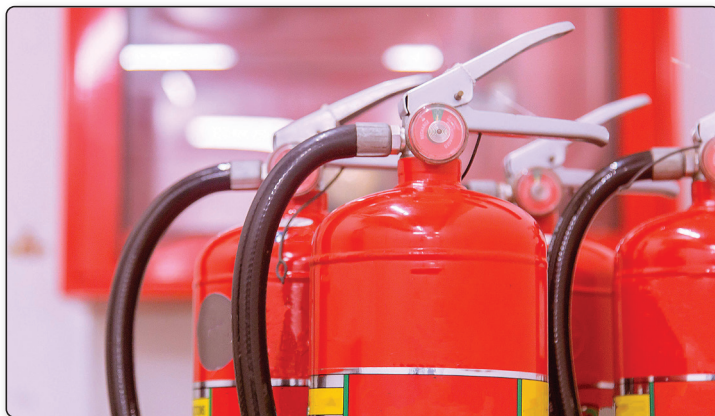
Figura 1.2. Los extintores de halón son ideales para talleres de reparación de computadoras. En la actualidad, algunos los han suplantado por los de gas Inergen, compuesto por nitrógeno, argón y dióxido de carbono, una mezcla invisible e inodora.