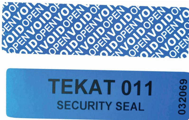
Figura 1.7. Las etiquetas void se utilizan desde hace tiempo en el armado de computadoras. Brindan seguridad tanto al cliente como al armador.