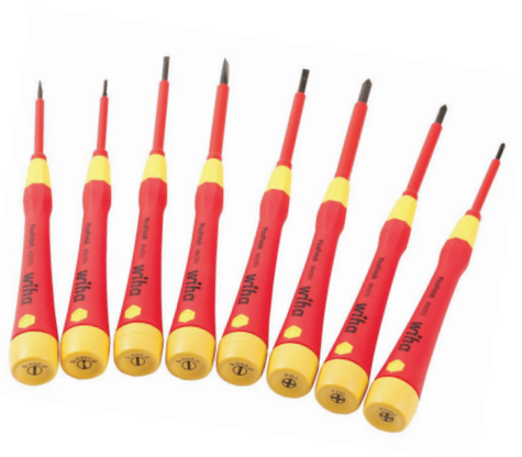
Figura 1.4. Ahora también existen atornilladores / destornilladores eléctricos, aunque los manuales son perfectos para esta actividad. Se venden sueltos o también en kits.