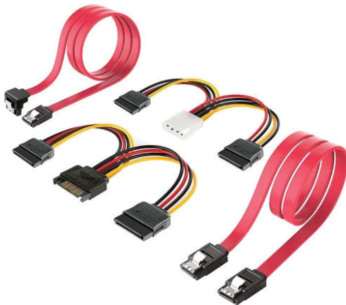
Figura 1.8. Contar con cables adicionales en la línea SATA y Power SATA es una ventaja. A veces los fabricantes de placas madre incluyen una sola unidad, y necesitas tener un cable extra en caso de que tu cliente requiera más de un medio de almacenamiento.