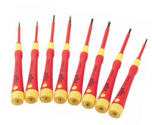
Figura 1.4. Ahora también existen atornilladores / destornilladores eléctricos, aunque los manuales son perfectos para esta actividad. Se venden sueltos o también en kits.