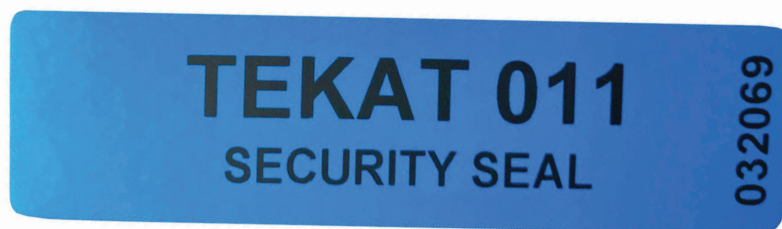
Figura 1.7. Las etiquetas void se utilizan desde hace tiempo en el armado de computadoras. Brindan seguridad tanto al cliente como al armador.