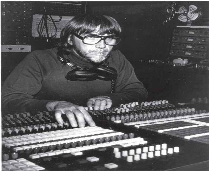
Figura 1.1. Tom Dowd

Es donde se da forma al conjunto global de todas las pistas de audio de la grabación, también es la fase donde se dinamiza y otorga una mayor presencia e impacto a las partes con mayor sentimiento y sensibilidad de una canción. Todo ello empleando diversas herramientas tanto del mundo digital como del analógico las cuales se utilizan para crear y llevar a cabo la culminación de la obra del artista o productor. Intentando de esta manera el acercar la idea global de la visión e imaginación la cual el artista ha querido plasmar o intentado representar al oyente.