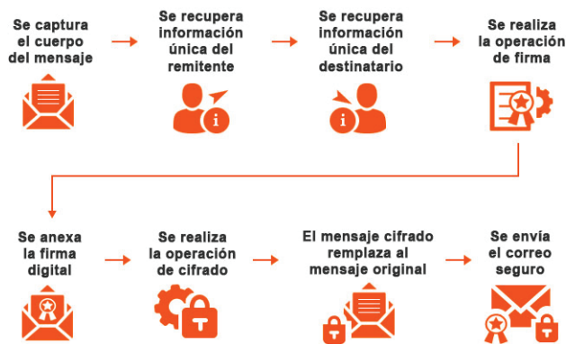
Figura 1.2. Proceso de firma electrónica

El resultado de todo este proceso es un documento electrónico obtenido a partir del documento original y de las claves del firmante. La firma electrónica, por tanto, es el mismo documento electrónico resultante.